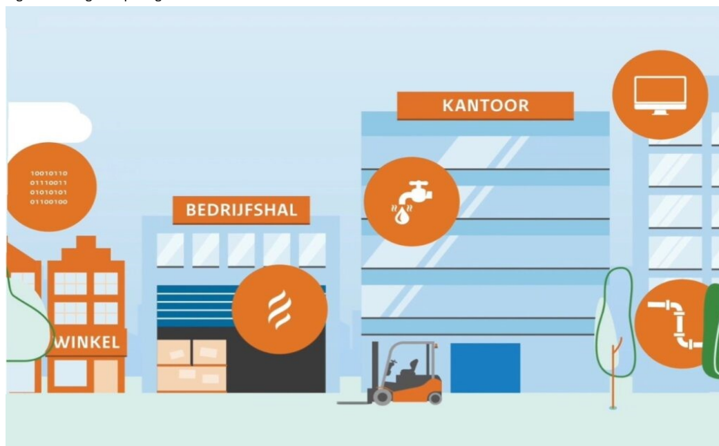
Figuur 3 energiebesparing

Ook moet per 1 januari 2023 elk kantoorgebouw minimaal energielabel C hebben. Voldoet het gebouw niet aan de eisen, dan mag het per 1 januari 2023 niet meer als kantoor gebruikt worden. Deze verplichting staat in het Bouwbesluit 2012. De RUD Drenthe heeft de expertise op het gebied van energiebesparing en energietoezicht in huis. Bevoegde gezagen kunnen de RUD Drenthe opdragen om deze taak op zich te nemen en/of hiervoor de RUD Drenthe te mandateren.