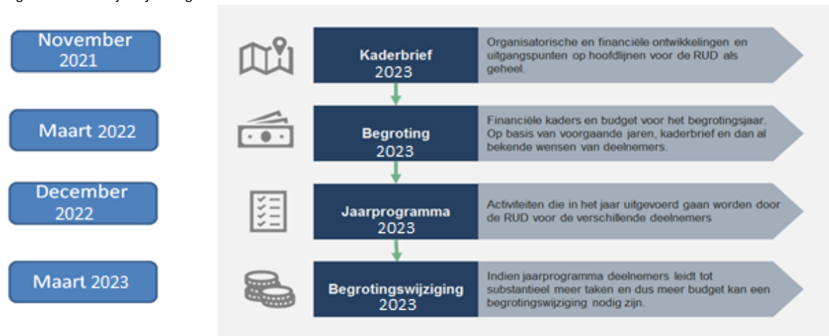
Figuur 1 overzicht jaarlijkse organisatorische en financiële documenten

Met onze kaderbrief worden de belangrijkste beleidsmatige, organisatorische en financiële ontwikkelingen beschreven, die van belang zijn voor het opstellen van de bijbehorende begroting. Op basis hiervan kunnen wij onze taken voor onze opdrachtgevers uitvoeren. Onderstaande afbeelding geeft de samenhang tussen de verschillende documenten weer.